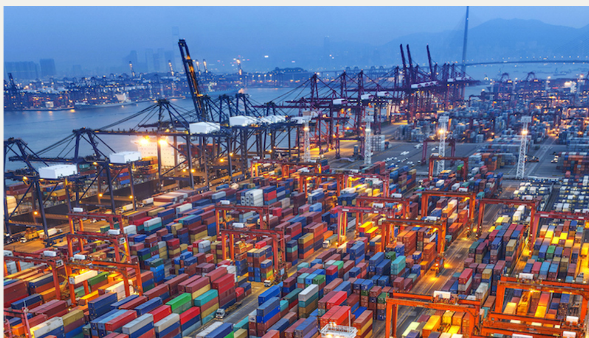
Marasi News, Improved cargo volume pushes ATI income higher , 05/18/2021

Découvrez le monde qui se cache derrière le plus grand port des Philippines ! Apprenez en explorant les facteurs économiques du port de Manille et son impact sur l'environnement dans cet article.